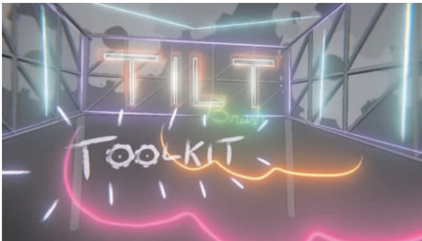
图 2 利用 TiltBrush 进行的艺术设计图

术专业的教育体系,这与数字媒体艺术“新工科”定位不符,更与数字媒体艺术和艺术的结合相背离。其教育体系“千校一面”,忽视了各高校数字媒体艺术学科建设之间的差异性。所以,将 VR 技术与数字媒体艺术教育结合应用,创新教育体系是学科建设的核心和重点。当前,很多课程体系,比如专业课、实践课等,都采用传统的教学模式,这样培养出来的学生,需要通过较长时间的实践,才能做好相关的工作。而通过 VR 技术,则可以为构建相应的实践应用场景,同时还可以将诸多新技术引入到实践课程中,包括企业的具体实战项目等,和企业生产一线的项目进行对接,这样